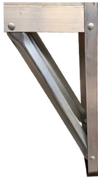
PRIMER PELDAÑO REFORZADO